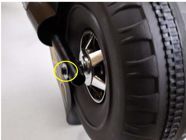
Natloukací víčko podložte. (obr. 12)